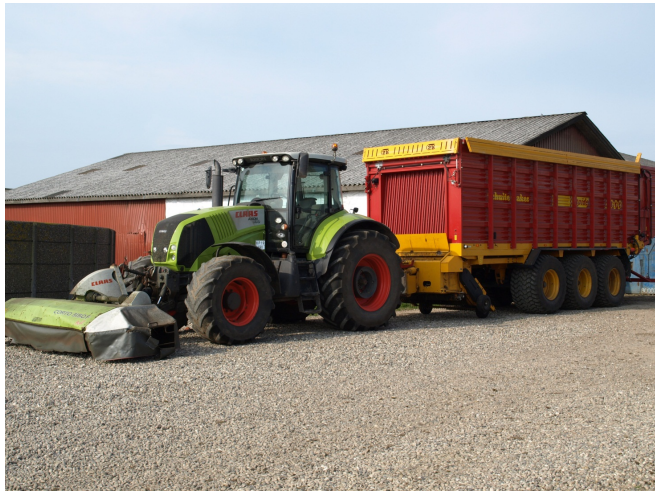
Snittevogn på Sønderhøjgård. (Klik på billedet for stor udgave).